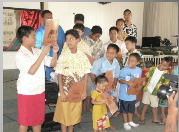
O tamaiti aoga a Le Fetuao i le taimi o le latou faafiafiaga.